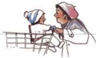
Levante a su niño